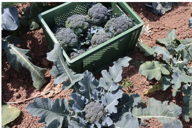
Zaměření na souvislosti spojuje pěstování například s otázkami týkajícími se ekonomického, právního a sociálního systému. Foto 7