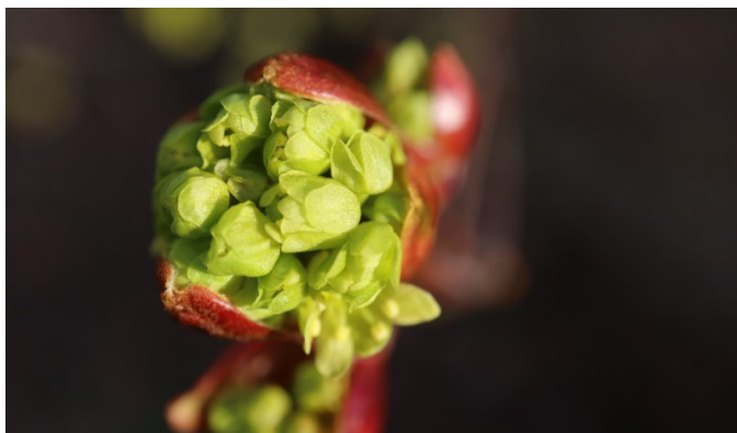
Učení podporuje rozvoj individuálního potenciálu, což zde, na konci brožury, symbolizují tyto rozvíjející se kvítky javoru. Foto 9.