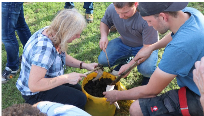
Procvičování praktických dovedností, překonávání vlastního ostychu, odvaha k činům a posilování vůle. Foto 2.

Co se děje? Vnímejte jev, pozorujteho, popište ho a ponořte se do něj. Ze zkušenosti dospějte k po- znání.