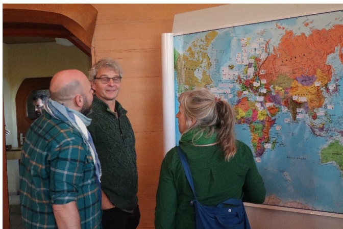
Biodynamika je celosvětové hnutí. Na všech kontinentech probíhají akce základního i dalšího vzdělávání. Foto 8.