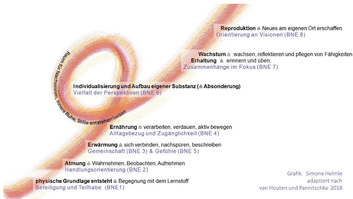
Schéma znázorňuje životní procesy dýchání, zahřívání, výživy, vylučování, udržování, růstu a reprodukce s fázemi procesů učení, jak je rozpracovali Coenraad van Houten a Sophie Pannitschka v knize „Erwachsenenbildung als Willenserweckung“ (2018, s. 78 a násl.), a propojuje je s principy Vzdělávání pro udržitelný rozvoj, VUR 1 až VUR 8, podle nichž je strukturována tato praktická brožura. Pro učení je důležitá také iniciace vzdělávacích procesů, při níž se vytváří fyzický základ pro zahájení vzdělávacího procesu. Tato fáze předchází životním procesům.

Sophie Pannitschka in van Houten et Pannitschka 2018, s. 14f.