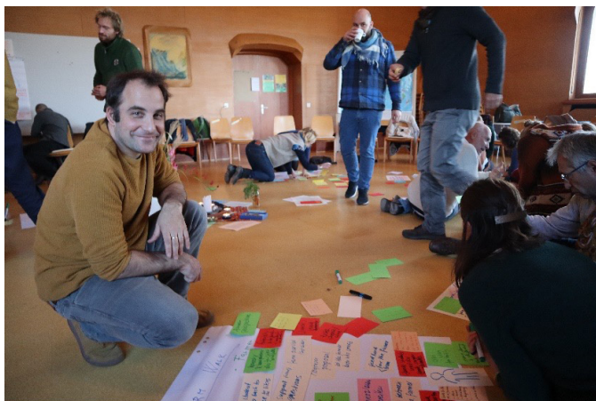
City dokáží dát jednání směr a sílu. Citlivost je pracovním nástrojem biodynamiky. Reflektování citů je samostatnou oblastí poznání. Foto 5.