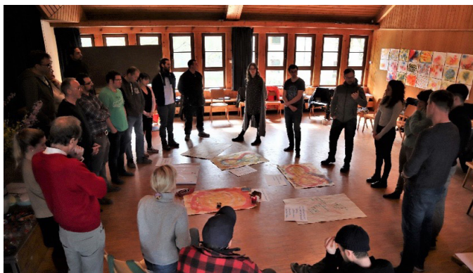
V malých skupinách pracujte na otázce, kreativně se zabývejte tématem, inspirujte se navzájem a podělte se o výsledky v plénu. Foto 3.