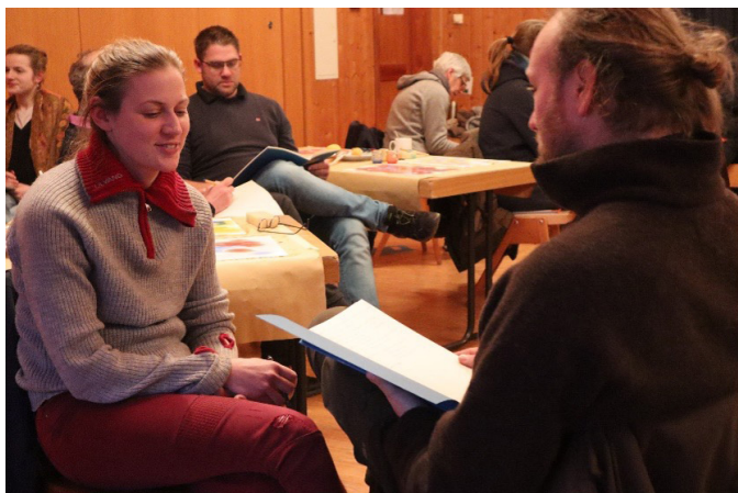
Vzájemné zapojení a rozhovor o vlastní motivaci vytváří sociální základ pro důvěru ve vzdělávacích skupinách. Foto 1.