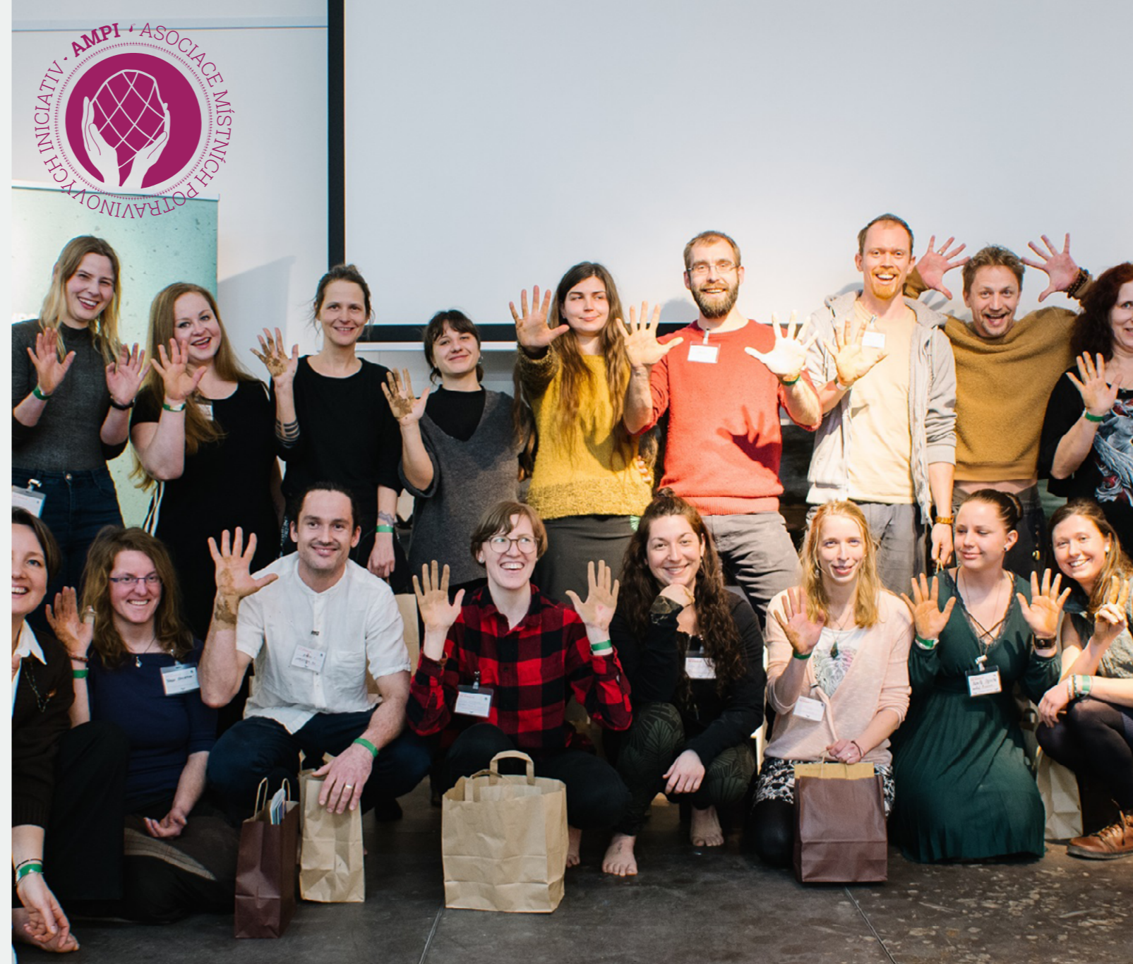
Symposium živého zemědělství inaugurace studentů Farmářské školy

Vědecko-výzkumná činnost v oblasti udržitelného zemědělství a místních potravinových systémů se zaměřením na zvyšování kvality lidského života a životního prostředí